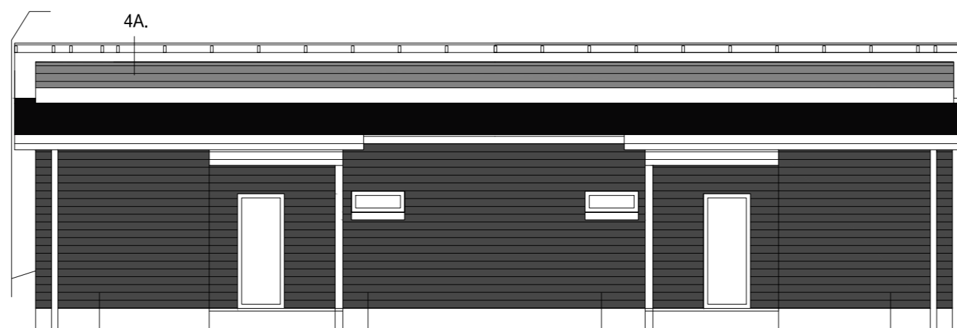
4A. SISÄÄNKÄYNTIJULKISIVU ITÄÄN