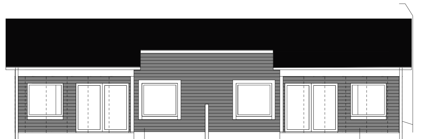
4A. PIHAJULKISIVU LÄNTEEN